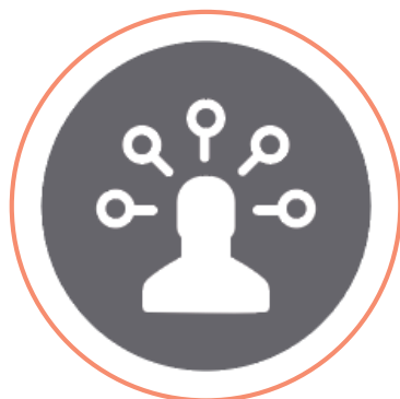
JORNADA GENERACIÓN IDEAS